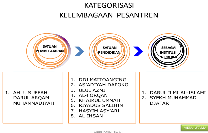
Grafik 1 Kategori Kelembagaan Pesantren

Kategori di atas menunjukkan fakta, bahwa ada Pesantren yang menjadikan pembelajaran kepesantrenan hanya sebatas satuan pembelajaran, menjadi pelengkap sebuah nama pesantren, bukan sebagai program inti. Beberapa Pesantren yang masuk kategori sebagai Satuan Pendidikan, menjadikan program pembelajaran kepesantrenan sebagai inti atau core dan yang lainnya sebagai pelengkap. Sedangkan Pesantren yang masuk kategori Satuan Institusi Terbuka adalah yang menjalankan program pembelajaran kepesantrenan sebagai inti, dan membuka peluang terbentuknya institusi baru dengan disiplin ilmu tertentu hingga ke Perguruan Tinggi Kejuruan.